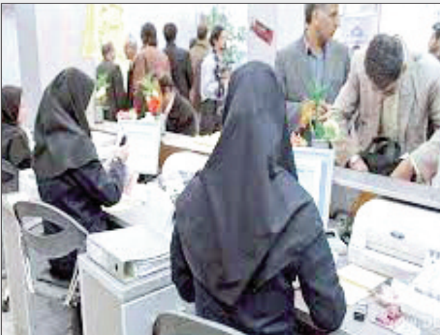
تکریم ارباب رجوع انجام شده است اظهار کرد: به دستور مدیر عامل این سازمان و با

وی در خصوص سامانه پیشخوان ارباب رجوع گفت: سهولت در استفاده کاربران از این سامانه مد نظر قرار گرفته است به گونه‌ای که ارباب رجوع به محض ورود به سامانه و تنها با احراز هویت توسط شماره تلفن همراه خود می‌تواند درخواست قابل پیگیری خود را بدون حضور در سازمان ثبت نماید و مدیریت‌های مربوطه موظف هستند در کمترین زمان ممکن پاسخ درخواست ارباب رجوع را اعلام نمایند و در طول روند پاسخگویی، هر گونه ارجاع درخواست درون سازمان از طریق پیامک برای فرد درخواست کننده ارسال خواهد شد. این مقام مسئول در ادامه به خدماتی همچون ارائه اطلاعات از طریق کیوسک مستقر در ستاد مرکزی اشاره کرد و گفت: نظرسنجی از ارباب رجوع، ثبت درخواست بدون حضور در واحد مربوطه، معرفی وظایف سازمان، روند پیگیری درخواست‌ها و ... از جمله خدماتی است که توسط این کیوسک ارائه می‌شود.