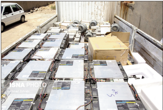
سال ۱۳۹۹ به ۱۲ و ۱۰ درصد در بهار سال ۱۴۰۰ افزایش یافته است.

ارائه این آمار از آن جهت نگران کننده است که افزایش استفاده غیرمجاز از دستگاه‌های استخراج رمز ارز در خانه‌ها یا