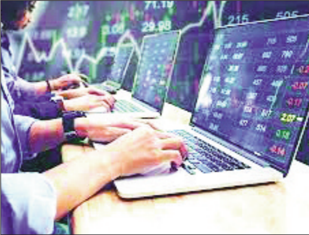
سخت نیست و کلاً شاید ۱۵ تا ۳۰ دقیقه بیشتر زمان نبرد. این کارشناس بازار سرمایه در رابطه با این پرسش که افراد با چه انگیزه ای

این کارشناس بازار سرمایه در ادامه اظهار کرد: سهامداران برای انتخاب کارگزاری معمولاً به خدماتی مانند اعتبارات کارگزاری، تخفیفات، مشاوران و موارد دیگر توجه می کنند. نکته بعدی که قابل ذکر و برای برخی از شهرستان ها بسیار حائز اهمیت بوده و هست، دسترسی فیزیکی به کارگزاری است.