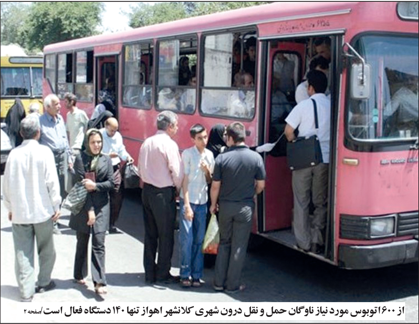
از ۱۶۰۰ تنبوس مورد نیاز ناوگان حمل و نقل درون شهری کلانشهر اهواز تنها ۱۴۰ دستگاه فعال است /صفحه ۲