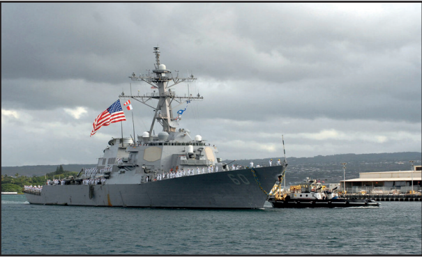
عهده‌دار است و همچنین حضور شناورهای نیروی دریایی سپاه،آنها مجبور به نشاندن بالگردها بر روی ناو می شوند.

دریادار پاسدار علیرضا تنگسیری فرمانده نیروی دریایی سپاه در تشریح این اقدام گفت: در این رصد ناوبالگردبر شناور امریکایی‌ها مبادرت به پرواز بالگرد می‌کنند اما بعد از اخطار کنترل پاند تنگه هرمز،ناو تیپ ذوالفقار که مسئولیت کنترل پاند ورودی را