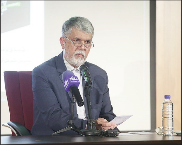
برای مسکن هنرمندان و برنامه و وعده های دولت چهاردهم اظهار داشت: اجازه بدهید این قول را زمانی بدهم که مطمئن شوم.

وی گفت: اکنون باندهایی وجود دارند که به راحتی راحت مالیات‌های افراد را با روش‌های مختلف صفر می‌کنند، سازمان مالیات با همکاری دولت و مجلس باید تمرکز خود را بر روی این افراد دلفه درشت متمرکز کند، در صورتی که سایر اقشار که سر موقع مالیات به حق را پرداخت می‌کنند و با شفافیت مشکلی ندارند.