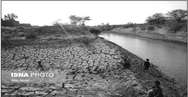
قمصری توضیح داده است

«بیقراری‌ای که مرا از گیلان به اهواز کشاند، در خاک خوزستان به این قطعه تبدیل شد. اصلا در مسیر خوزستان به اینکه چه باید نواخت فکر نمی‌کردم. می‌دانستم حسی که دارم مسیر را برای خلق هموار می‌کند.»