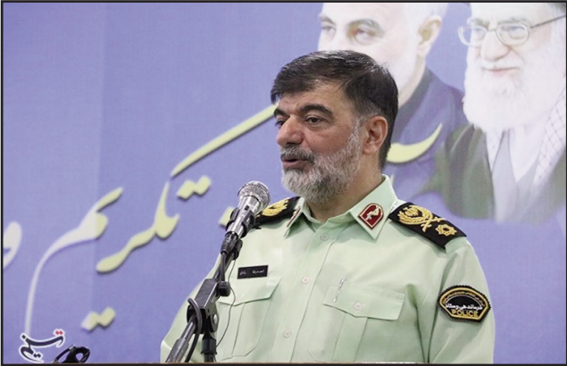
دوربین محقق شده است.

فرمانده کل انتظامی گفت: مرزبانان، پلیس پیشگیری، پلیس راهور، یگان امداد، یگان ویژه و ... از جمله پلیس‌هایی هستند که نیاز به نصب دوربین البسه دارند.