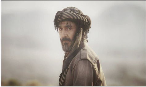
تصویر مهدی نصرتی بازیگر فیلم سینمایی «پیشمرگ»