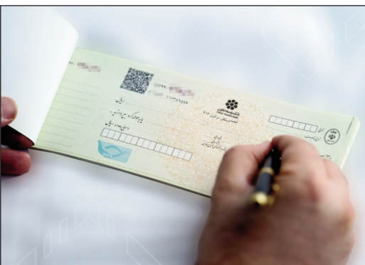
بهره مند شوند.

ریبهای در پاسخ به این پرسش که آیا تراز تجاری ایران با این کشورها به سمت مثبت شدن میل می کند، گفت: تراز تجاری ایران با کشورهای غرب آسیا در ۹ ماهه سال جاری مثبت بوده است، رشد صادرات به این کشورها حدود ۳۱ درصد بود و در مقابل رشد واردات حدود ۲۱ درصد بود از این رو میزان صادرات ما نسبت به واردات بیشتر بوده است.