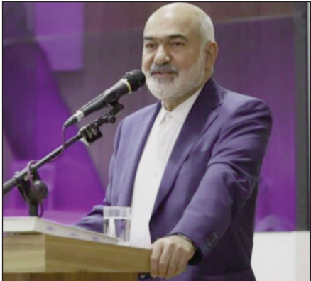
استاندار خوزستان در جریان بازدید از بازار عمده‌فروشی

استاندار خوزستان به وضعیت کیفیت نان در خوزستان اشاره کرد و گفت: از آنجایی که این استان از بهترین گندم برخوردار است باید آرد و نان با کیفیت تولید کند، اما در شرایط فعلی اینگونه نیست که باید اصلاح شود.