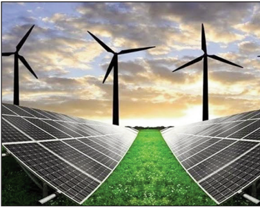
تصویری از نیروگاه‌های تجدیدپذیر انرژی خورشیدی و بادی

بنابر گفته مسئولان ساتبا، در حال حاضر حدود ۵ هزار مگاوات به بهره‌برداری رسیده و ظرفیت قابل توجهی نیز در دست اقدام است، اما این ۳۵ هزار مگاوات نیازمند مدیریت موثری است تا ساخته‌گاه‌هایی که پیشرفت لازم را ندارند، بازپس گرفته شده و به مقاصضیانی که پای کار هستند واگذار شود.