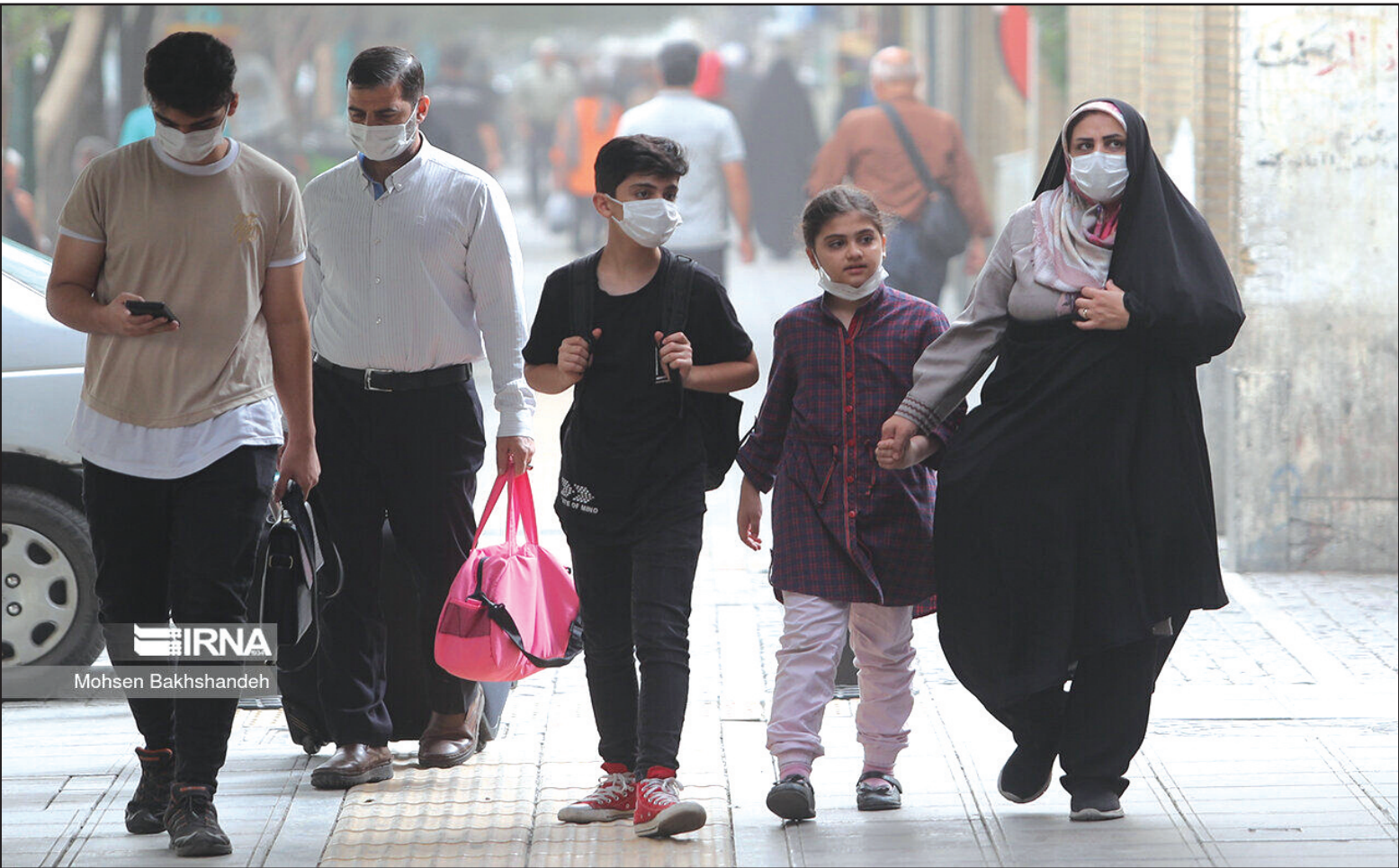
مدیرعامل برق منطقه‌ای خوزستان: