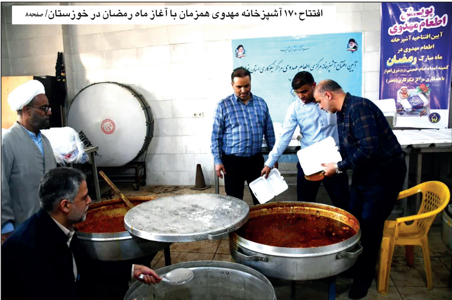
افتتاح ۱۷۰ آشپزخانه مهدوی همزمان با آغاز ماه رمضان در خوزستان/ صفحه ۸